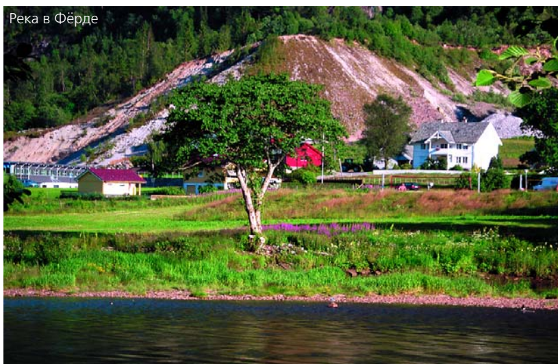
Река в Фёрде

Еще были интересные коллективы из Финляндии, Швеции, Дании. Например: «Hyperborea» («Гиперборея»), «Frifot» («Состояние свободы»), «Hangaard & Hoi-gur» («Хангор и Хейрюп»). А утром четвертого дня в Фёрде прошел парад, посвященный фестивалю. По улицам города шли барабанщики и трубачи, клоуны и жонглеры, акробаты и танцовщицы. Люди радовались, и дети, и взрослые смеялись,