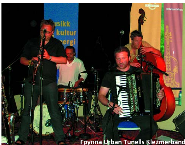
Группа Urban Tunells Klezmerband