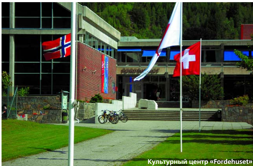
Культурный центр «Fordehuset»