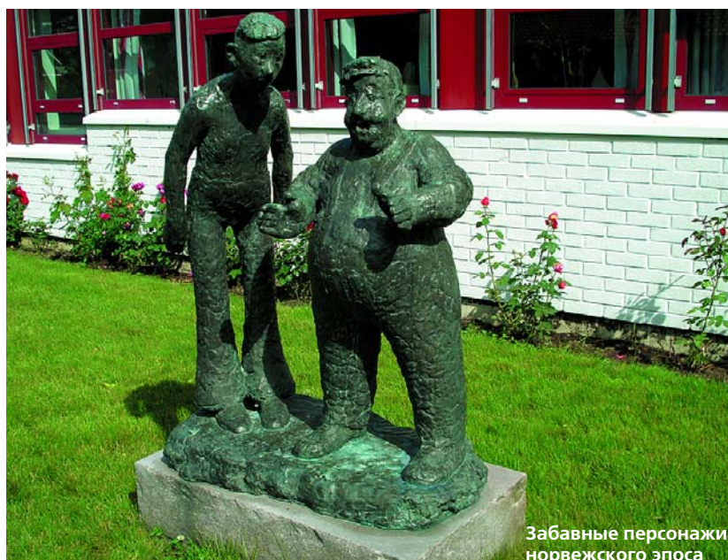
Забавные персонажи норвежского эпоса