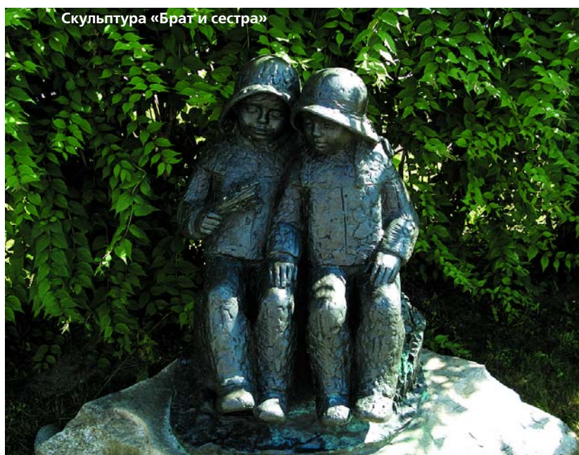
Скульптура «Брат и сестра»

а я подумала о том, что таких праздников должно быть как можно больше не только в Норвегии, но и во всем мире. Тогда наша планета наполнится счастьем и ни у кого не останется поводов для грусти.