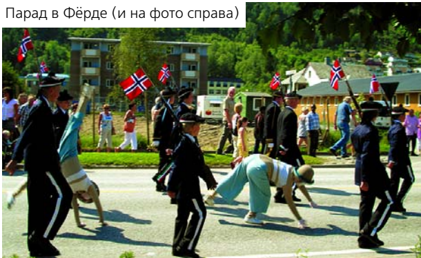
Парад в Фёрде (и на фото справа)