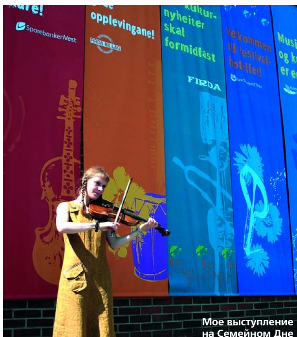
Мое выступление на Семейном Дне